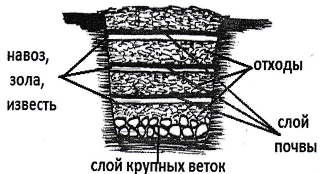
схема компостной кучи

Соедините место стыка концов сетки степлером или гвоздями с бруском. Бруски должны быть параллельны после крепления.